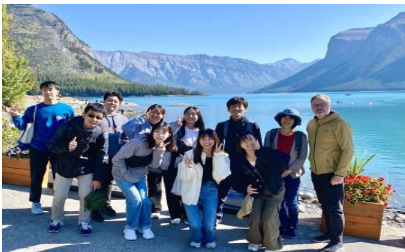
【 海外研修旅行（カナダ） 】