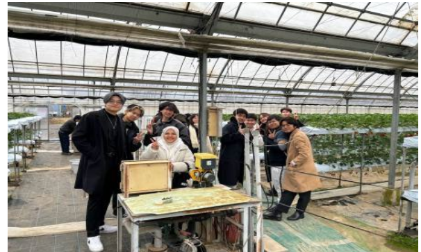
【 外国人留学生研修旅行 】