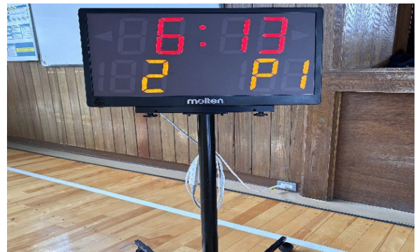
【 課外活動施設充実 】