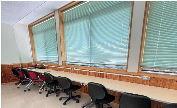
【 図書館2階ロビー自習スペース 】